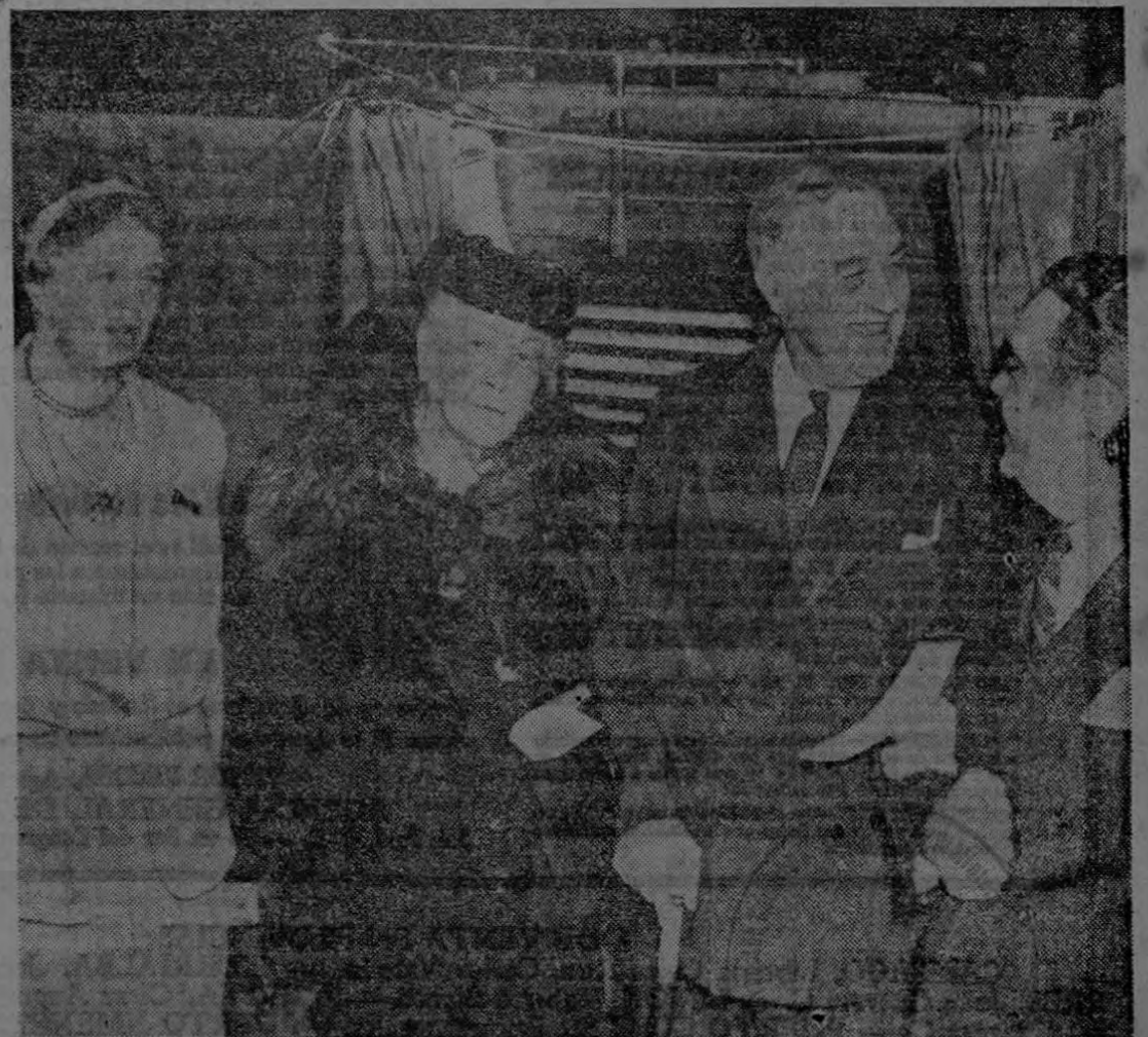
El Presidente Roosevelt de los Estados Unidos, sonrió confiadamente al depositar su voto en Hyde Park, Nueva York, en las elecciones presidenciales del día 6 de noviembre. Roosevelt fué elegido para el tercer término presidencial, estableciendo un precedente en la historia de los Estados Unidos. Aquí vemos al jefe supremo de la nación con su familia. De izquierda a derecha: su esposa, su madre, (la señora Delano Roosevelt), el Presidente y un guardia de corps. Esta foto de la International Illustrated News fué enviada por avión a este periódico.