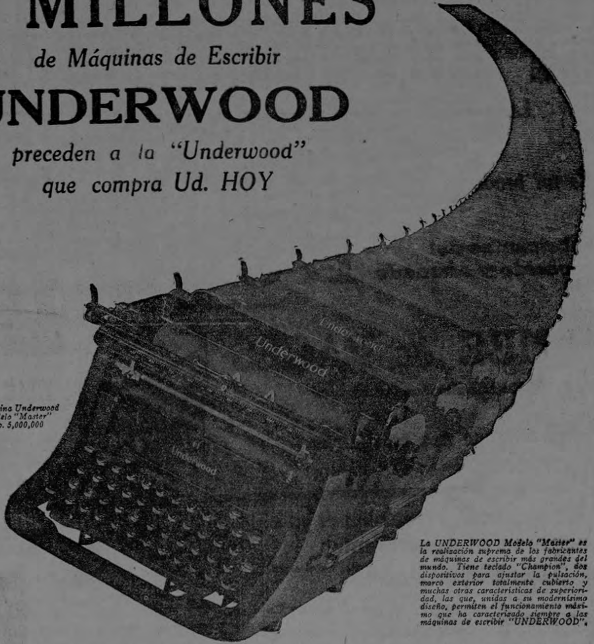
La UNDERWOOD Modelo "Master" es la realización suprema de los fabricantes de máquinas de escribir más grandes del mundo. Tiene teclado "Champion", dos dispositivos para ajustar la pulsación, marco exterior totalmente cubierto y muchas otras características de superioridad, las que, unidas a su modernísimo diseño, permiten el funcionamiento máximo que ha caracterizado siempre a las máquinas de escribir "UNDERWOOD".

Cinco millones de máquinas de escribir para escritorio... cinco millones de máquinas de escribir sin contar la gran producción de máquinas de escribir UNDERWOOD Portátiles! Estos resultados constituyen la mejor prueba de la alta calidad y funcionamiento eficiente de la "UNDERWOOD" y ofrecen también la razón de mayor peso para que, si usted no lo ha hecho, elija la UNDERWOOD como la máquina de su preferencia.